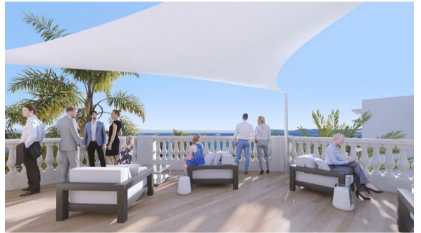
Musée La Malmaison (Cannes)