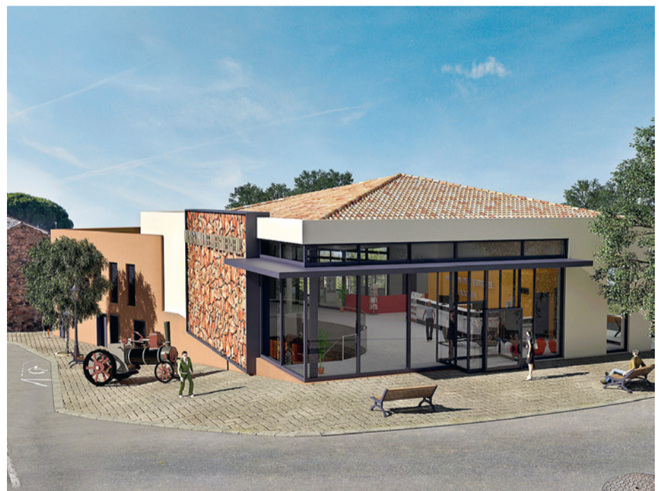
La Maison de l'Estérel (Les Adrets de l'Estérel)

C'est ainsi qu'après des projets de restructuration de bâtiments pour le compte de divers maîtres d'ouvrages publics, elle remporte plusieurs concours et projets dont un premier collège en 2006.