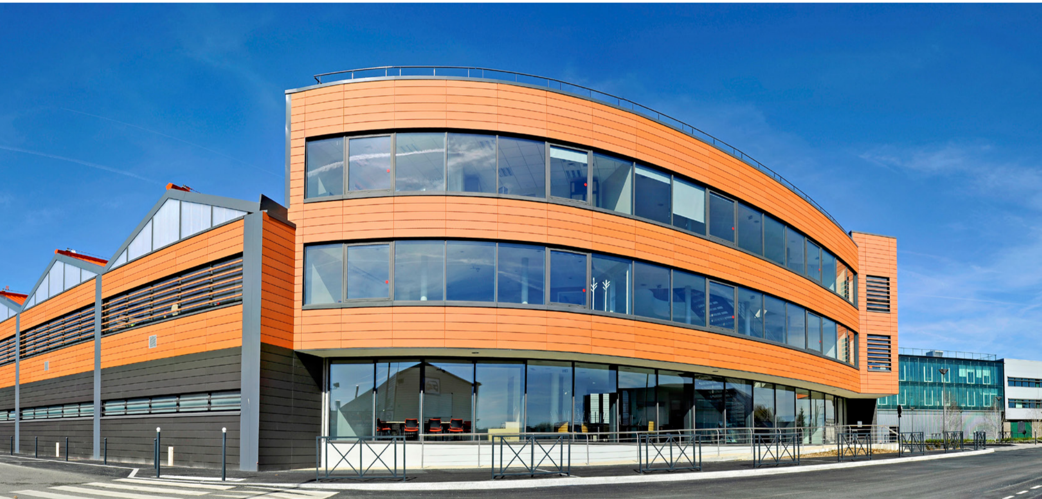
Pépinière d'entreprises (Montmagny)