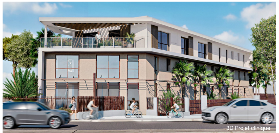
3D Projet clinique