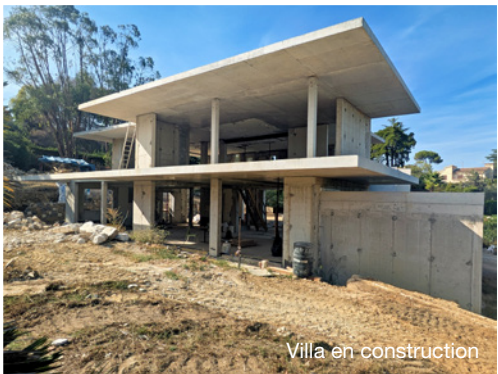
Villa en construction

Le premier, une maison de 265 m 2 située dans un domaine à Mougins, lui a offert une carte blanche créative dans un cadre réglementaire très strict. Avec un style moderne et minimaliste, des matériaux aux teintes sable et corten, de larges baies vitrées et des volumes pensés pour s’adapter au terrain. Elle a su imaginer une habitation fluide et lumineuse, où la végétation joue un rôle majeur.