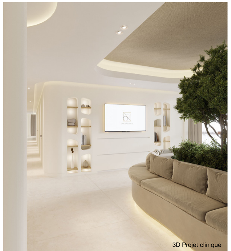
3D Projet clinique