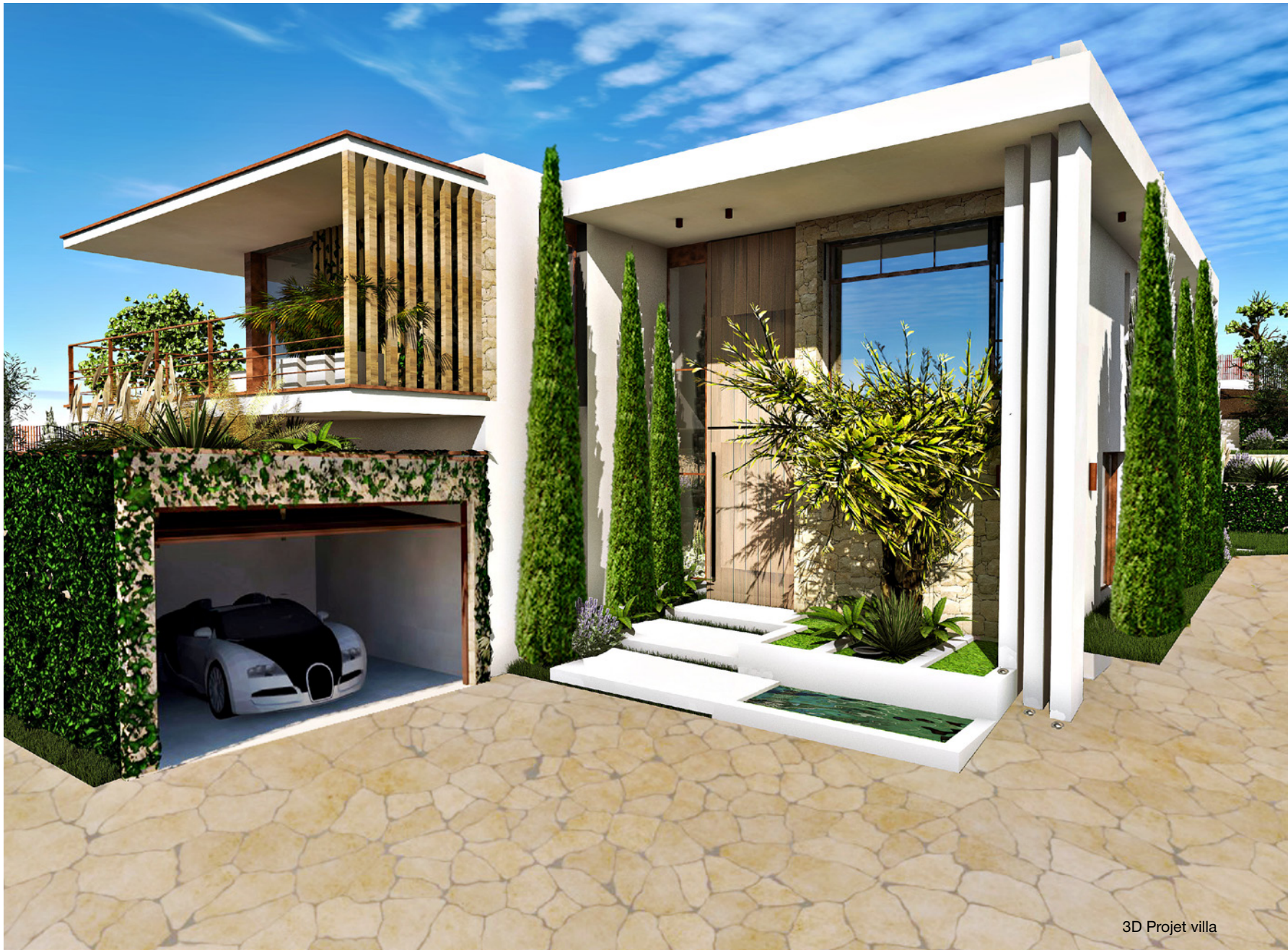
3D Projet villa