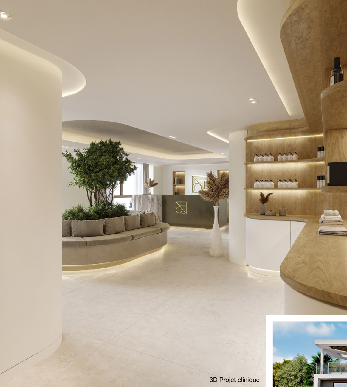
3D Projet clinique