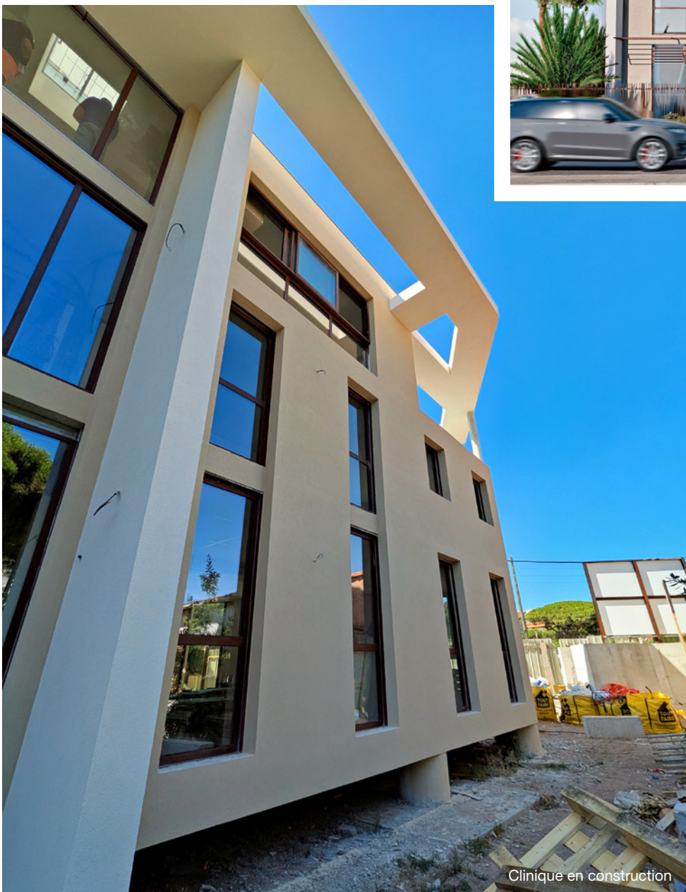
Clinique en construction

Deux projets différents, un même fil conducteur : élégance, justesse et créativité au service d'une architecture profondément humaine.