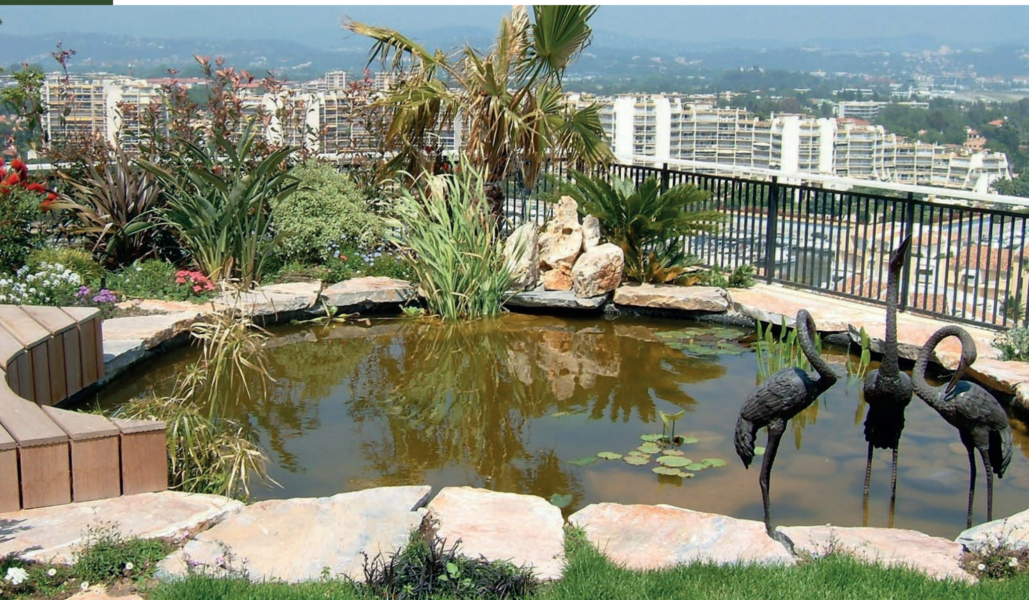
Parfois l'élément eau vient se percher sur les hauteurs, ici au 13 ème étage d'une terrasse paysagée.