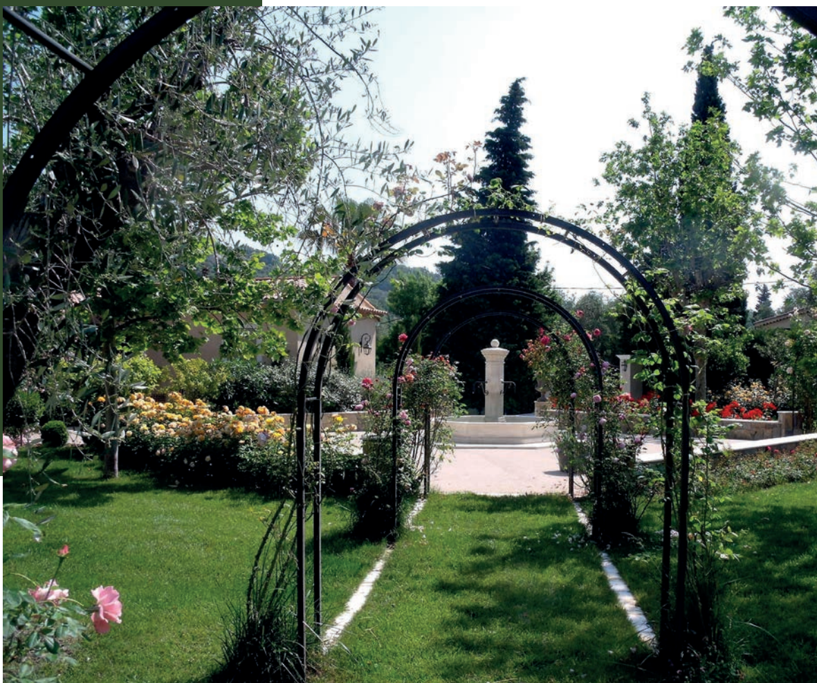
Roseraie et fontaine.