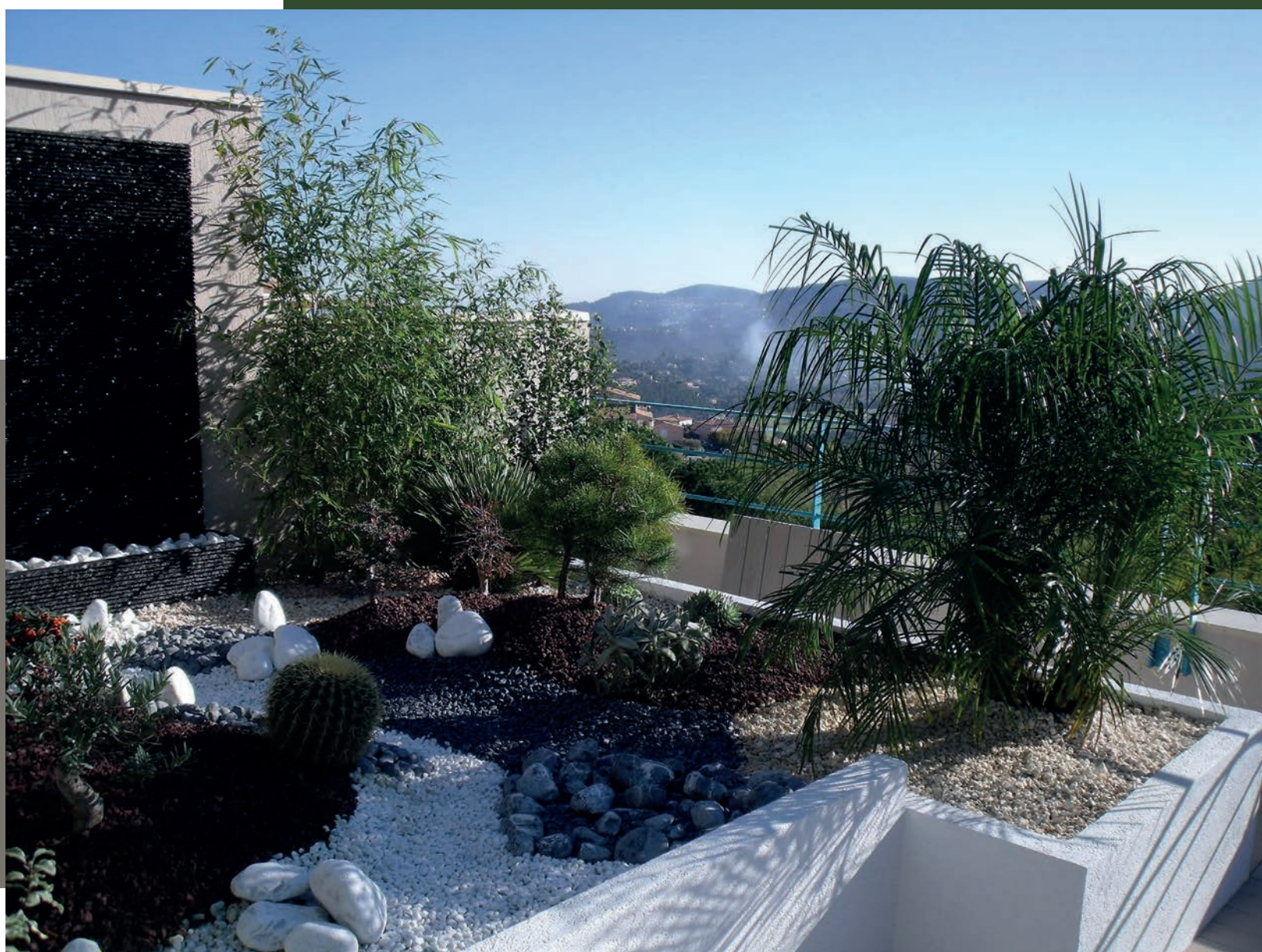
Mur d'eau avec aménagement paysager minéral.