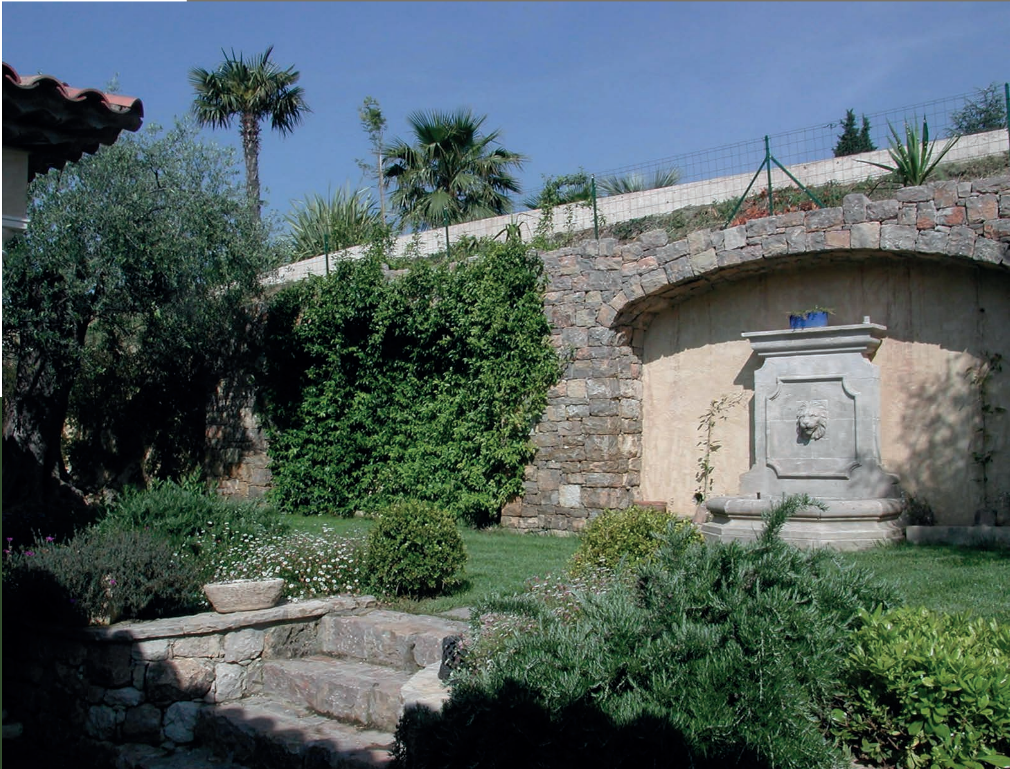
Fontaine murale sous arche en pierre.